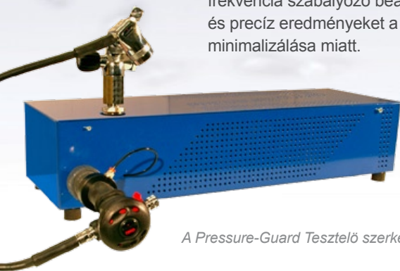
A Pressure-Gard Tesztelő szerkezet

Pressure-Guard lehetővé teszi a légzési frekvencia szabályozó beállítását és precíz eredményeket a holttér minimalizálása miatt.