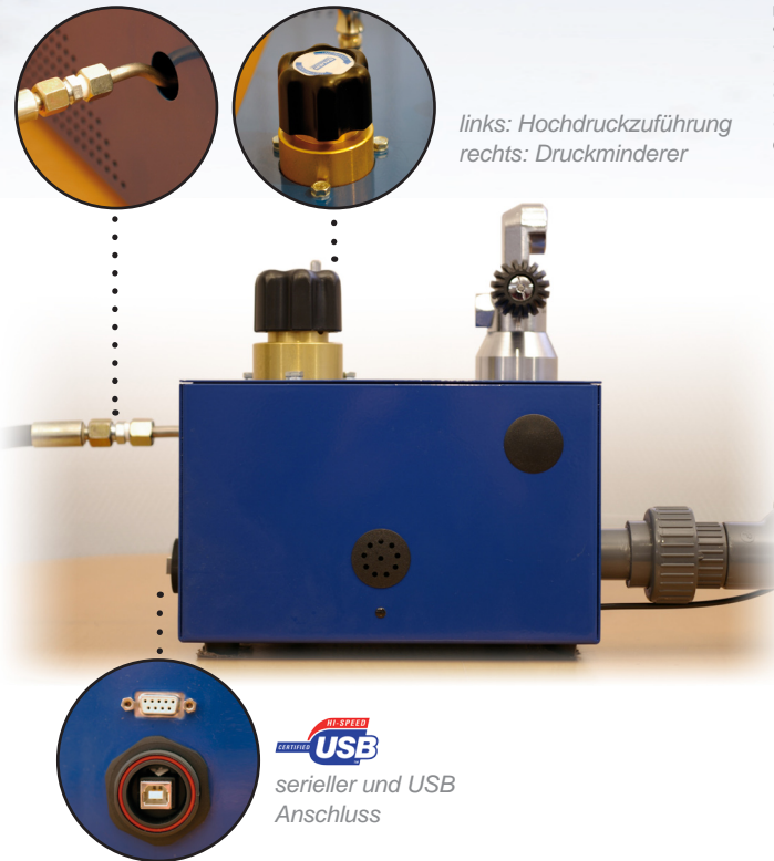
links: Hochdruckzuführung rechts: Druckminderer

Optionaler Druckminderer USB 2.0 Anschluss (zusätzlich zum seriellen Anschluss) Atemregler bis 300 bar möglich